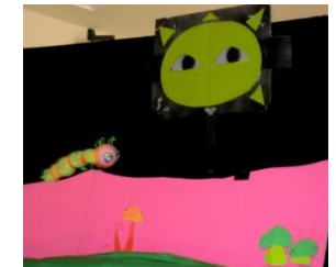
可愛い手作り人形